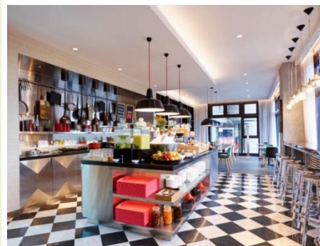
台北北门世民酒店 - 走在世界前沿的移动一族

连同位于澳门的两家非品牌酒店的管理合约,雅辰将于2018年底营运共8家酒店、共约1,900间房间。