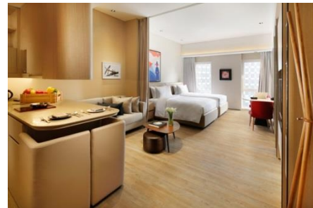
北京东直门雅辰悦居酒店 - 放松身心,享受愉悦之旅

雅辰酒店集团(「雅辰」)于年内进入新里程,推出了旗下两家品牌酒店。 然而,由于预计有四家新酒店物业将于明年开幕,因此出现庞大的开业前开支,令酒店及消闲部录得溢利按年增加百分之一百一十八至港币四千六百万(二零一六年:亏损港币二亿六千三百万元)。