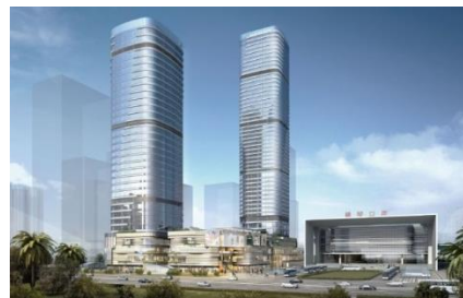
横琴综合发展项目 - 连接至澳门及横琴的边检设施