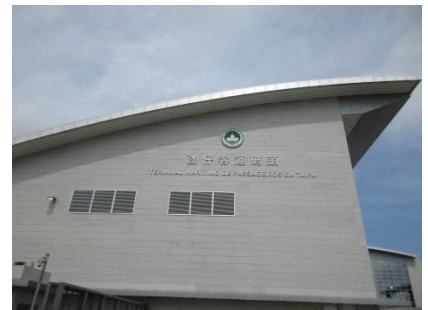
新落成的氹仔客运码头