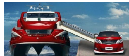
「尊豪+」免费专车接驳服务