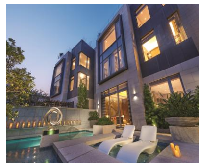
春磡角洋房 - 豪华尊贵洋房项目