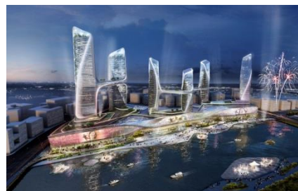
北京通州综合发展项目