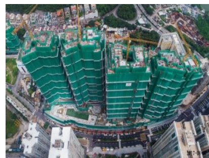
濠尚的住宅大厦已于二零一七年六月平顶