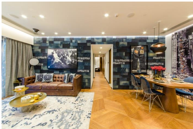
位于澳门旅游塔的濠尚示范单位