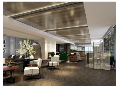
雅辰会 - 贵宾廊 (效果图)

集团拓展旗下酒店及消闲业务,并开设一个 私人商务会所-雅辰会 。该会所将于二零一八年第二季开业。请继续关注了解更多消息!